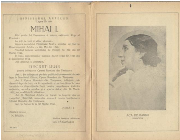
Decretul de înființare a Operei din Timișoara, emis de Regele Mihai I 1